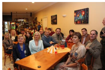
Zemgales reģiona uzņēmēji

2012. gada 07. decembrī Latvijas Darba devēju konfederācijas pārstāvji kopā ar Cēsu un Bauskas uzņēmēju klubiem devās organizāciju vizītē uz Bausku. Uzņēmēju vizītes ietvaros tika apspriesti būtiski jautājumi sociālā dialoga stiprināšanai, sadarbojoties ar pašvaldībām un arodbiedrībām, kā arī tika atzīmēts gada noslēgums .