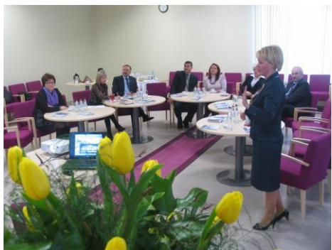
ZDDP tiekas ar JRPIC vadību.

Zemgales reģiona profesionālās izglītības iestādes, lai identificētu problēmas un pārrunātu turpmāko sadarbību.