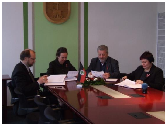
Līdzdarbības līguma parakstīšana. Jēkabpils, 14.11.2012.

Viens no būtiskākajiem šā gada panākumiem ir Jēkabpils pilsētas pašvaldības, LDDK, Latvijas Brīvo arodbiedrību savienības un Jēkabpils Uzņēmēju biedrības atkārtoti noslēgtais Līdzdarbības līgums , kas paredz kopīgiem spēkiem risināt pilsētas attīstībai aktuālus jautājumus. Ilgstošu sarunu rezultātā, tomēr izdevās iesaistīt visas puses, arī arodbiedrību pārstāvjus.