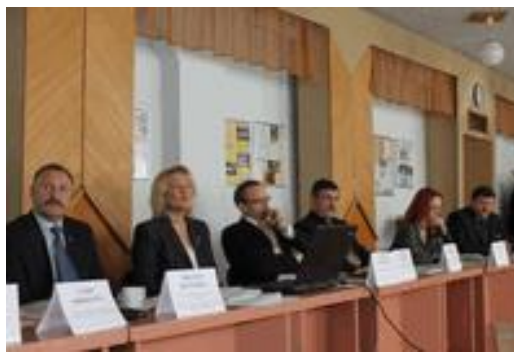
ZDDP tiekas ar Jelgavas Amatniecības vidusskolas vadību.