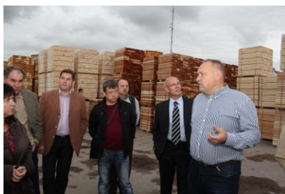
Zemgales reģiona uzņēmēji iepazīst uzņēmuma SIA „Ošukalns” darbību

LDDK iniciētajā pasākumā piedalījās Jēkabpils Uzņēmēju biedrība, Jelgavas Ražotāju un tirgotāju asociācija, uzņēmēju klubs „Bauska 97”. Darba devēju organizāciju tikšanās laikā tika apmeklēti arī vairāki Jēkabpils uzņēmumi - dārzu audzētava un tirdzniecības uzņēmums „Rītausma”, apģērbu ražotne „Gefa Latvija”, durvju ražotne „BroDoor” un mežizstrādes un kokapstrādes uzņēmums „Ošukalns”.