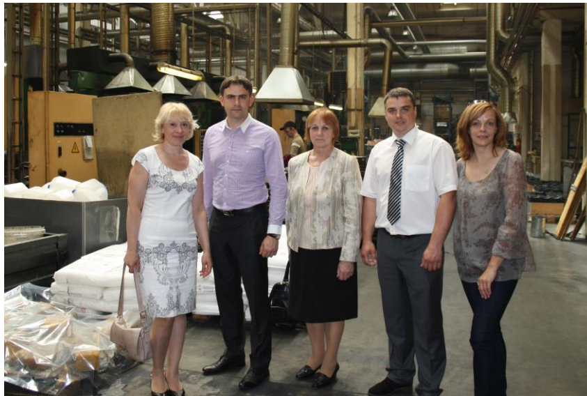
5. attēls: Reģionālo darba devēju organizāciju sanāksme Jelgavā, Rēzeknes Uzņēmēju biedrības un LDDK pārstāvji. Foto no LDDK Latgales reģiona darba devēju konsultatīvā centra, 2014. gada jūnijs.

2014. gada I pusgadā Rēzeknes Uzņēmēju biedrība pieredzes apmaiņas vizītē Rēzeknē uzņēma Preiļu novada uzņēmējus (aprīlī), kā arī piedalījās Latvijas reģionālo darba devēju organizāciju sanāksmē Jelgavā.