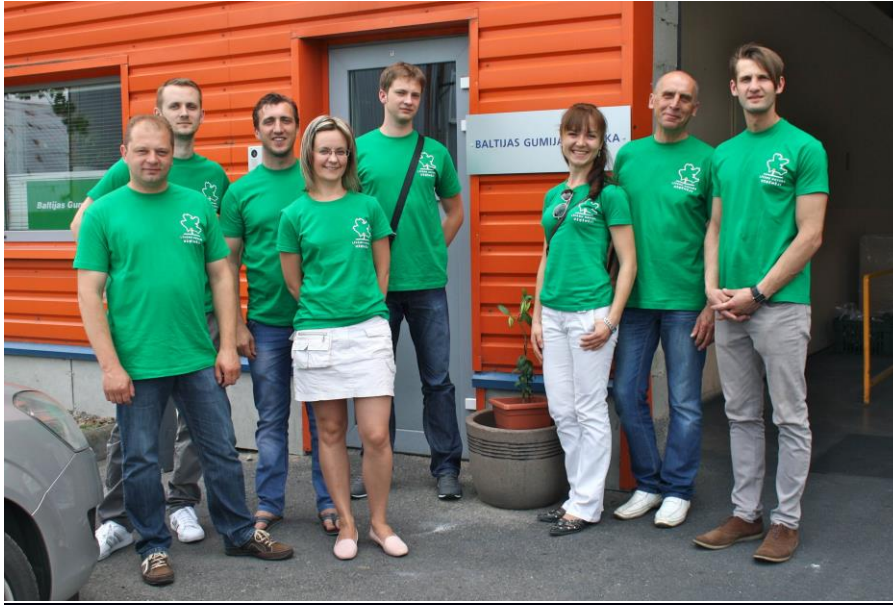
5. attēls: Biedrības “Līvānu novada uzņēmēji” pārstāvji reģionālo darba devēju organizāciju sanāksmē Jelgavā. 2014. gada jūnijs.

Citas darba devēju organizācijas Latgales reģionā , kurām nepieciešama darbības kapacitātes stiprināšana, jo pārskata periodā aktīva darbība nav notikusi: