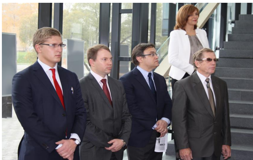
2. attēls: Rēzeknes Uzņēmēju biedrības pārstāvji un LDDK sociālā dialoga koordinatore Latgales reģionā uzņēmējaisabiedrību izstādes "Rēzeknes Uzņēmējs" atklāšanā 10.10.2013.

Biedrības darbības mērķu un uzdevumu īstenošanai izveidota stabila biedrības organizatoriskā struktūra – biedrības uzraudzības institūcija ir biedrības Padome, kas sastāv no deviņiem Padomes locekļiem; biedrības pārvaldes jeb izpildinstitūcija ir biedrības valde, kas sastāv no viena valdes locekļa. Biedrības biedru darba sanāksmes tiek sasauktas ne retāk kā reizi mēnesī. Biedrības biedru sapulces notiek ne retāk kā vienu reizi pusgadā.