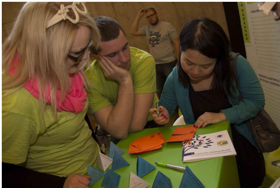
3. attēls: Profesionālās un augstākās izglītības iestāžu izstāde “Izglītība un Karjera”. Foto no Rēzeknes Uzņēmēju biedrības, 2014. gada marts.

Pārskata periodā 2014. gada 27. martā notika biedrības organizētā profesionālās un augstākās izglītības iestāžu izstāde “Izglītība un Karjera”, kurā piedalījās vairāk nekā 10 mācību iestādes. Partnerībā ar LDDK Latgales reģiona darba devēju konsultatīvo centru skolu jauniešiem un augstskolu studentiem tika rīkotas tematiskās diskusijas – tikšanās ar uzņēmējiem (pārtikas pārstrāde un sabiedriskā ēdināšana; finanses un banku pakalpojumi; ražošana un metālapstrāde; IT un radošās industrijas).