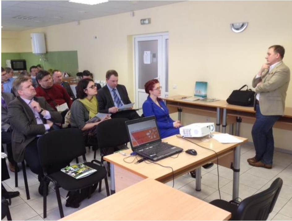
6. attēls: Rēzeknes Uzņēmēju biedrības un Preiļu novada uzņēmēju un pašvaldības pārstāvju diskusija ar AS "Swedbank" galveno ekonomistu Latvijā Mārtiņu Kazāku.

Foto no LDDK Latgales reģiona darba devēju konsultatīvā centra, 2014. gada aprīlis.