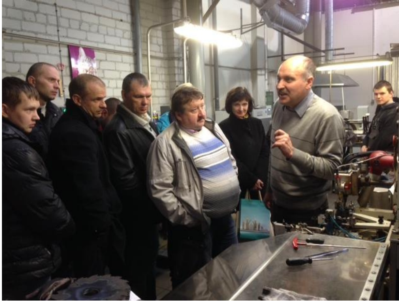
4. attēls: Preiļu novada uzņēmēju un pašvaldības pārstāvju vizīte Rēzeknē, metālapstrādes uzņēmuma SIA RKF "NOOK, Ltd" apmeklējums.

2014. gada aprīlis.