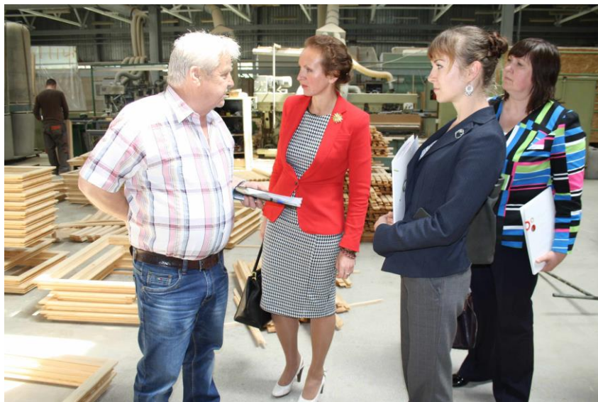
7. attēls: LDDK reģionālā vizīte Līvānos. Tikšanās SIA “Līvānu mājas un logi”. 2014. gada 21.maijs.

Līdzīgi arī Līvānu novada uzņēmēji akcentē uzņēmējdarbības vides attīstībai būtiskus jautājumus – darbaspēja pieejamība, pašvaldību un valsts uzņēmumu sadarbība infrastruktūras projektu īstenošanā, industriālo teritoriju attīstība, ekonomikas izaugsmes tendences, Publisko iepirkumu likums, aktuālītātes nodokļu jomā. Pēc LDDK reģionālās vizītes un diskusijas ar uzņēmējiem un pašvaldības vadību Līvānos 2014. gada 21. maijā LDDK ģenerāldirektore Līga Menģelšone secina, ka “Līvānu novada pašvaldība ir ļoti ciešā dialogā ar uzņēmējiem, attīstās divpusējais sociālais dialogs, izveidota konsultatīvā padome, darbojas biedrība “Līvānu novada uzņēmēji”. Tas nozīmē, ka Līvānu novada uzņēmējiem ir iespēja skaidrā un saprotamā veidā piedalīties novada attīstībā. Otrkārt, pašvaldība ļoti labi izprot savu lomu attiecībā uz uzņēmējdarbībai nepieciešamās infrastruktūras un kvalitatīvas dzīves vides veidošanu novadā. Treškārt, iezīmējas ļoti skaidras jomas, kurās Līvānu novada uzņēmēji ir ļoti spēcīgi – optiskās šķiedras ražošana, kūdras ieguve un pārtikas industrija, un var novēlēt, lai šo jomu uzņēmēji kļūst par labākajiem Latvijas, Baltijas un Eiropas līmenī. Kā pozitīvo piemēru veiksmīgai uzņēmējdarbībai noteikti jāmin kompāniju “Z-light”, kas ir pasaules līmeņa ražotājs.”